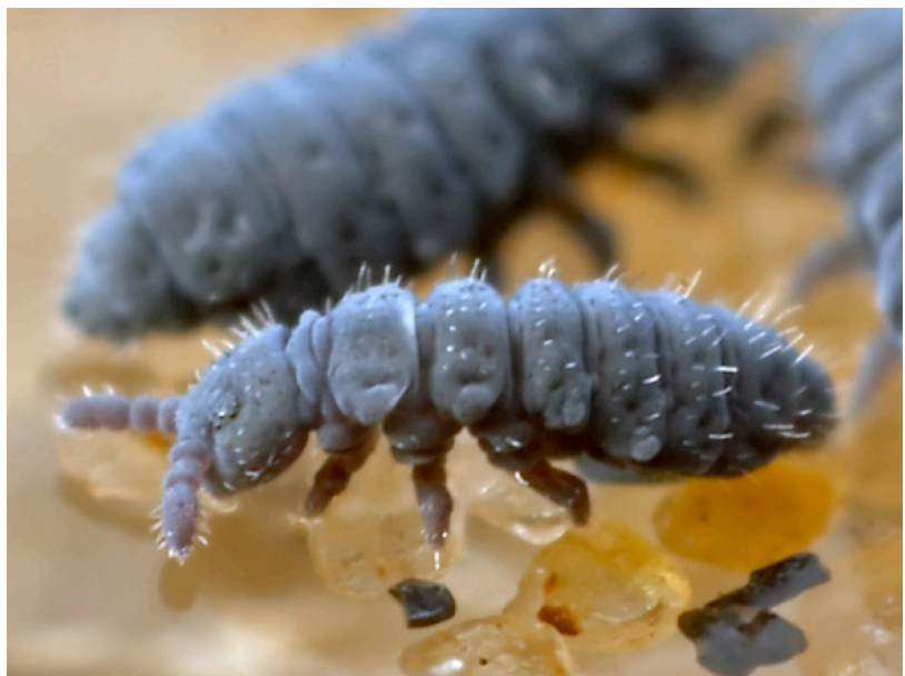
Abb.B3: Foto eines Collembola (Hypogastruridae)