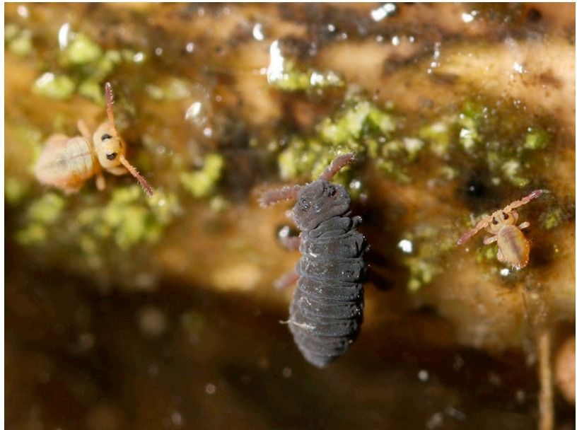
Abb.B4: Zwei typische Collembolaarten die auf der Oberfläche von Süßwasserflächen zu finden sind.

Durch gezielte Nahrungswahl steuern Collembolen Mineralisierungsprozesse und können als Pilzfresser das Pflanzenwachstum positiv beeinflussen. Die wenigsten Arten, wie der Luzernefloh, gelten als Schädlinge für Agrarsysteme. Springschwänze können gelegentlich für Monokulturen im Freiland ebenso wie für Zimmerpflanzen schädlich werden, wenn ihre eigentliche Nahrungsquelle, pflanzlicher Detritus, zur Neige geht und sie die lebenden Feinwurzeln anfressen.