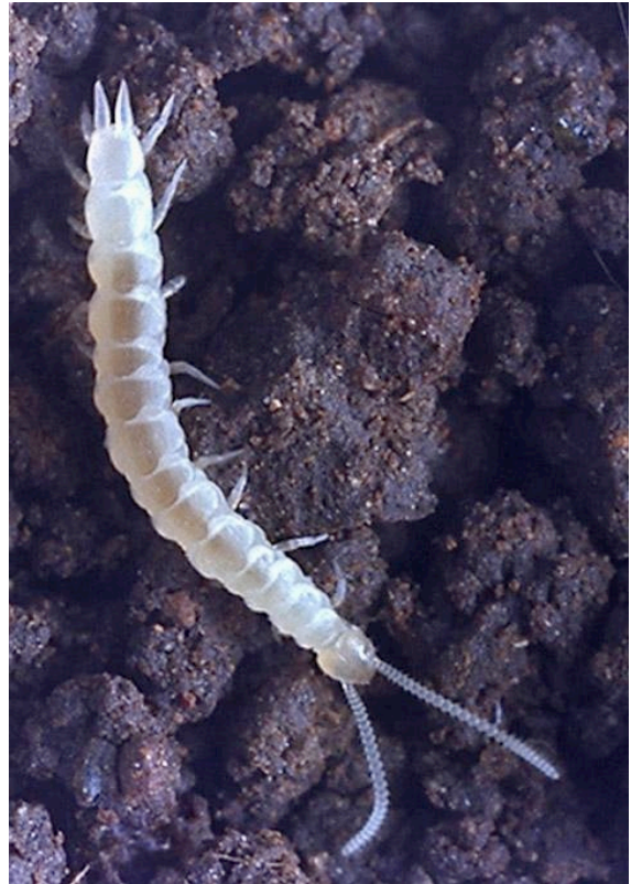
Abb.A3: Scutigerella immaculata

Die europäischen Arten der Zwergfüßer werden in zwei Familien aufgeteilt, die Scolopendrellidae (beispielsweise mit Symphylella vulgaris ) und die Scutigereleidae (mit Scutigerella immaculata , S. tusca , S. pagesi , S. remyi und S. silvatica ).