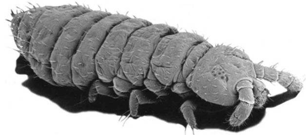
Abb.B2: Springschwanz der Familie der Hypogastruridae