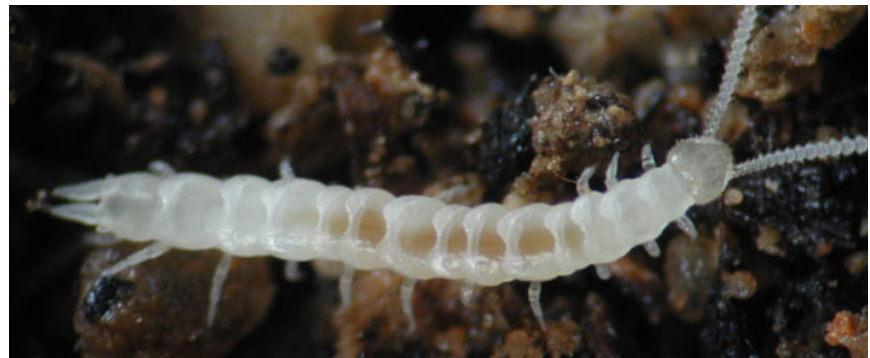
Abb.A2: Ein Vertreter der Familie der ScutigereLLidae